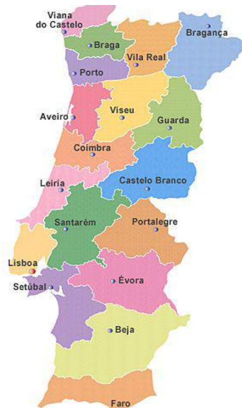
Mapa de Portugal